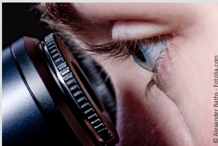
Wurzelbehandlung mit Hilfe des Mikroskops: Bis zu 25-fache Vergrößerung ermöglicht exaktere Arbeiten und bessere Ergebnisse.

Wurzelkanäle sind nur wenige Zehntelmillimeter dünn. Sie können Verästelungen, Krümmungen oder Stufen haben. Mit bloßem Auge sind solche Feinheiten nicht erkennbar. Deshalb werden sie leider oft übersehen.